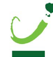
Table de concertation jeunesse de Sherbrooke